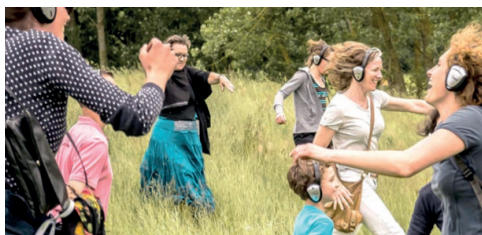
Images des performances de Rimini Protokoll et de Happy Manif

Mon envie, en tant que metteuse en scène, est de proposer une sorte de cartographie immersive et interactive. J'imagine cette création comme un territoire à explorer intimement, seul et collectivement. Ce projet prendra donc la forme d'une enquête guidée, réalisée avec la complicité du public, voire d'un jeu dans lequel il sera amené à être partie prenante du déroulement du spectacle : en prenant la parole dans un micro, en créant des mouvements de groupe, en faisant des choix.