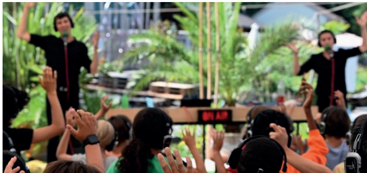
Public en immersion pour À l'envers, à l'endroit et Arborescence programmée